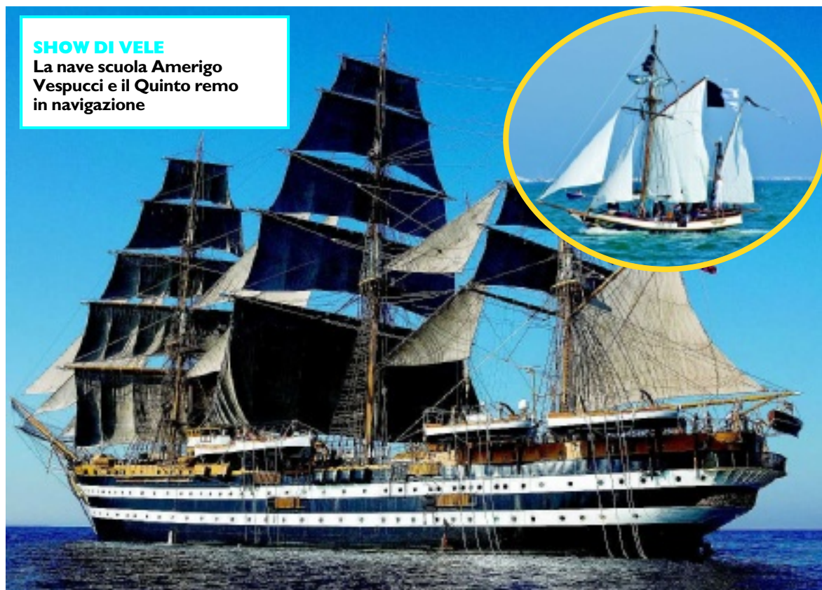
SHOW DI VELE La nave scuola Amerigo Vespucci e il Quinto remo in navigazione

dorsale il Comitato delle borgate: «Metteremo in rete tradizioni, mestieri, conoscenza, tecnologia e sapere per realizzare un grande richiamo turistico sull'intero water front ma anche per dare linfa ai percorsi economici in atto, grazie alle realtà di eccellenza del nostro territorio». Il nascente Distretto delle tecnologie marine diventa così orizzonte di riferimento. Non a caso, poi, «Maina» si salderà poi al workshop internazionale «Seafuture» della Camera di commercio. Il gioco di squadra si allargherà così ai centri di ricerca: Università, Enea, Nurc, Centro di vulcanologia. E agli stessi cantieri navali, che saranno, per l'occasione, visitabili. Manfredini non è entrato nel dettaglio, un po' per creare l'attesa, un po' perché in effetti la macchina organizzativa deve ancora ingranare le marce alte. Ha fatto dei numeri: «Realizzeremo 100 eventi, in mare e a terra, col Golfo teatro delle regate e via Mazzini trasformata in una sorta di cantiere della memoria». Poi, nelle more della messa a punto delle iniziative per valorizzare la presenza della Marina militare con un coinvolgimento che sia interprete delle linee guida del 'patto', ha indicato nell'evento che ha avuto luogo nell'Arsenale in occasione della Festa di San Giuseppe — la rappresentazione teatrale «La Vista del Mondo» nell'area dei bacini — un «riferimento importante».