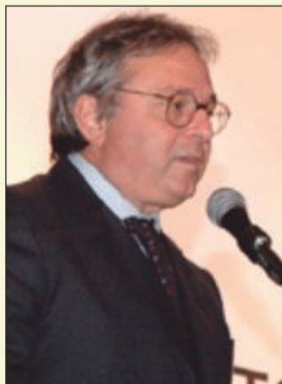
Nella foto: Gian Mario Spacca

ANCONA - Raggiunto l'accordo tra Regione Marche e Ministero delle Infrastrutture per la presidenza dell' Autorità Portuale di Ancona . Il governatore Gian Mario Spacca e il ministro Altero Matteoli hanno sottoscritto il 2 marzo scorso un accordo di programma per lo sviluppo dello scalo, proposto dalla Regione. La giunta ha dato mandato a Spacca di esprimere l'intesa per la nomina dell'avvocato livornese Luciano Canepa , proposto dal ministro Altero Matteoli , come presidente dell'Autorità Portuale. Secondo il presidente della giunta regionale Spacca «non ci sono stati scambi, abbiamo sempre detto che per noi il progetto di rilancio del porto veniva prima delle candidature per l'Autorità Portuale e così è stato. Il ministro ha condiviso il nostro progetto, che